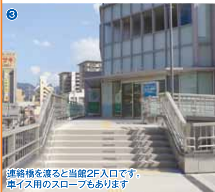
3 連絡橋を渡ると当館2F入口です。車イス用のスロープもあります