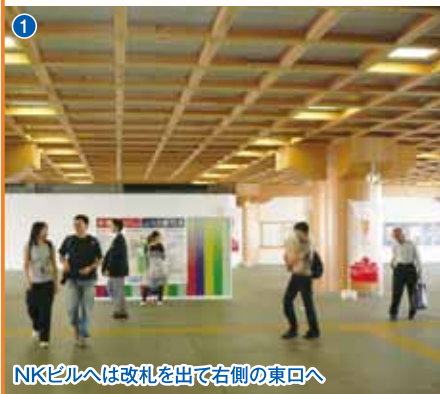
1 NKビルへは改札を出て右側の東口へ