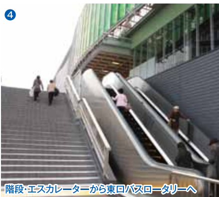
4 階段・エスカレーターから東口バスロータリーへ