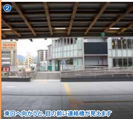
2 東口へ向かうと、目の前に連絡橋が見えます